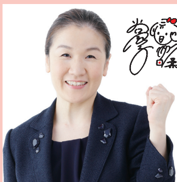
谷亮子参議院議員